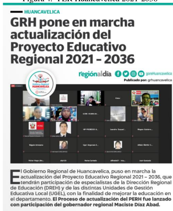
Figura 4.- PER Huancavelica 2021-2036