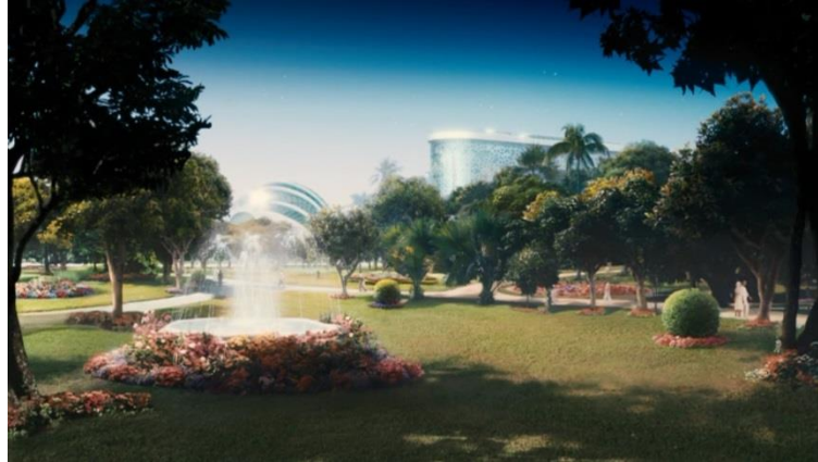
Figura 1. Referências imagéticas do Éden caracterizam Nosso Lar.

Por sua vez, as imagens demoníacas designam o âmbito da natureza inferior a ser dominada (Frye, 2004). Em Nosso Lar , percebeu-se a utilização de imagens com essas características para a representação do “umbral”, definido no filme como “uma espécie de purgatório” no processo de tradução entre nomenclaturas. Segundo Frye (2004, p.173), as imagens demoníacas se caracterizam pelo aspecto árido, sem vida, de paisagens em ruínas, vinculadas à morte e às glórias passageiras. No enquadramento a seguir podemos verificar na representação do umbral a presença dessas referências na caracterização do espaço mencionado.