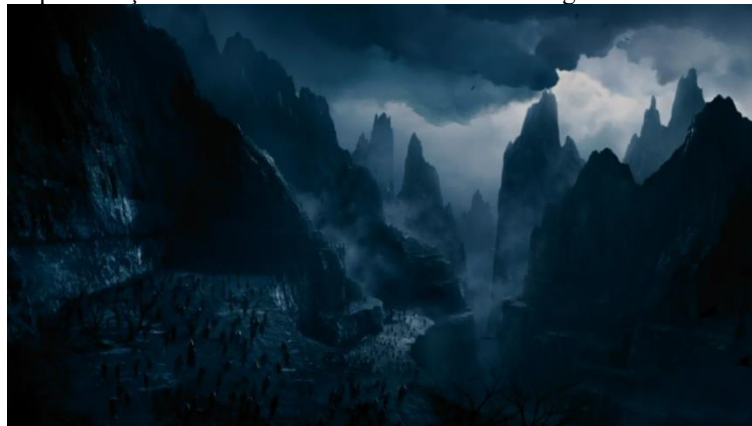
(Fig.2) A representação do “umbral” em sintonia com as imagens demoníacas da Bíblia.

De acordo com Frye (2004), existem duas categorias de imagens demoníacas: uma paródico-demoníaca “associado às nações pagãs temporariamente bem-sucedidas; e o manifesto do tipo você-vai-ver-só, a terra devastada, plena de ruínas, assombrada por hienas e corujas, em que aquela glória passageira fatalmente se transformará” (FRYE, 2004, p.173). Em Nosso Lar , este conjunto de imagens também aparecem em uma relação de causalidade. O personagem André Luiz era um médico vaidoso e bem sucedido. Mas, como pai e marido, era distante e tinha vícios. A narrativa tendeu a evidenciar esta condição como parte das glórias passageiras. As cenas que promoviam esta leitura moral da